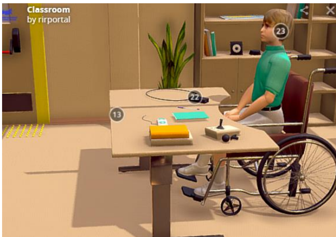
Рис.4. Модельное решение (ученический стол)