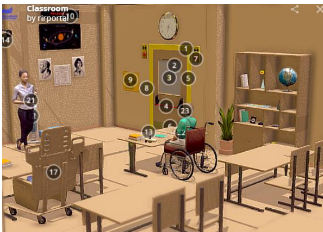
Рис.2. Модельное решение (общий вид)