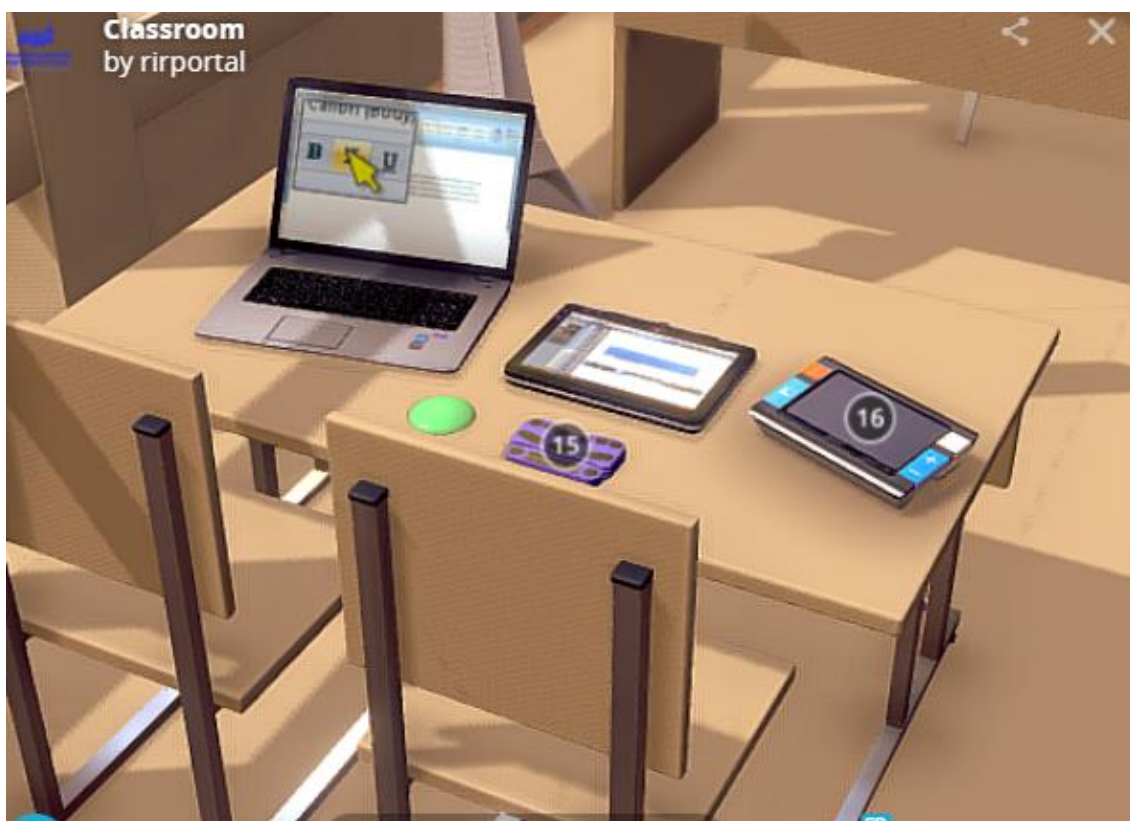
Рис.5. Модельное решение (адаптированная компьютерная техника)