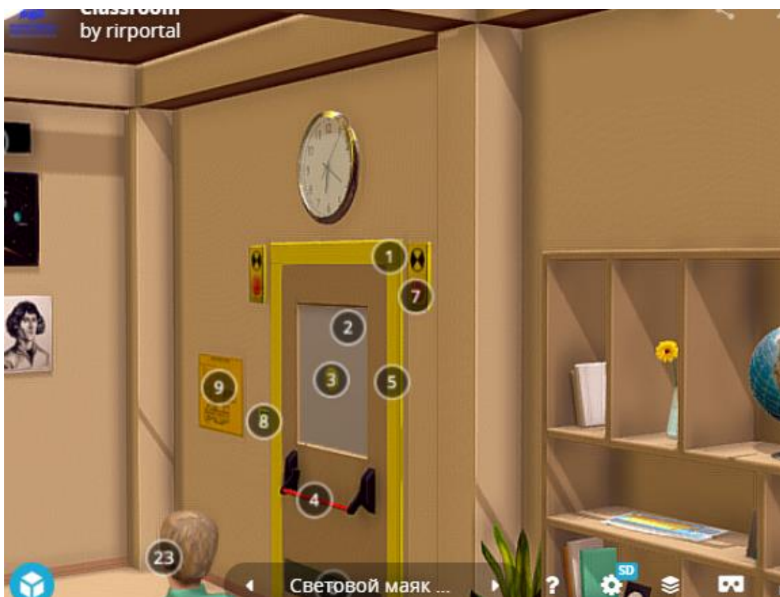
Рис.6. Модельное решение (входная группа)