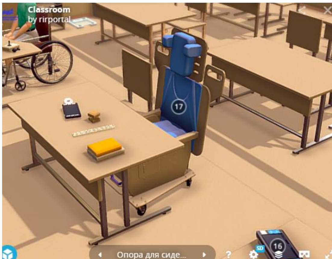
Рис.3. Модельное решение (ученический стол)